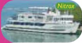
Bay Islands, Honduras