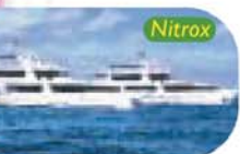
Galapagos Islands, Ecuador