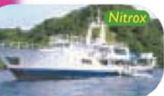
Cocos Island, Costa Rica